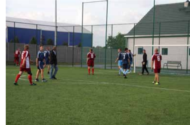
Kawalerowie pokonali Żonaty 11:4