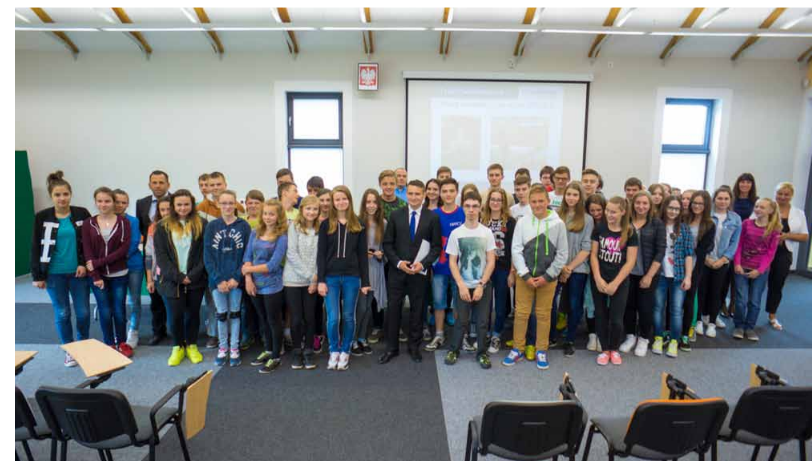
Spotkanie Posła Michała Jarosa z młodzieżą w ramach Lekcji Samorządności w prusickiej Multitece

Michał Jaros, Posel na Sejm Rzeczypospolitej Polskiej