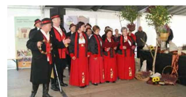
Podczas finału nie zabrakło krótkiego występu Zespołu Ludowego Strupinianie

mirodających i zakwalifikowało się do realizacji projektu. Pod koniec kwietnia bieżącego roku, mieszkańcy wsi Strupina posiadali wspólnymi siłami kilkadziesiąt krzewów róż, lawendy i innych roślin. Prace trwały 3 dni. Najpierw został przygotowany teren pod nasadzenia, a następnie sadzono roślinki. W ramach prac powstał drugi skwer różany na placu koło krzyża, a także strefa roślinna przy szkole i punkcie przedszkolnym. W akcji udział wzięło ogólnie przez wszystkie dni około 50 osób. W ten sposób dzięki pracy mieszkańców oraz przy wsparciu Fundacji Ekologicznej „Zielona Akcja” powstała strefa przyjazna przyrodzie. W pobliżu posadzonych kwiatów powstaną również tzw. „hoteliki” dla pszczoł samotnic, a przy szkole ustawiona zostanie tablica edukacyjna. Wspólnie sadząc kwitnące krzewy oraz zioła, mieszkańcy nie tylko upiększyli miejscowość, ale także stworzyli „stołówek” dla wielu pożytecznych owadów. Nasadzenia zrealizowane zostały w ramach projektu „Pszczoly