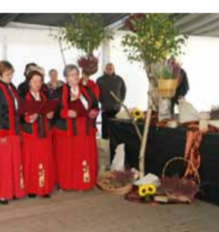
Podczas finału nie zabrakło krótkiego występu Zespołu Ludowego Strupinianie

W 2015 roku Stowarzyszenie otrzymało po raz drugi dofinansowanie z Urzędu Marszałkowskiego w wysokości 5 tys. zł na zadanie dotyczące promocji idei Odnowy Wsi Dolnośląskiej na realizację projektu obejmującego organizację „II Różanego pożegnania lata”, zakup materiałów promocyjnych, roll-upa oraz tablicy informacyjnej.