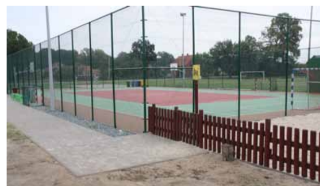
Mieszkańcy Piotrkowic mają nowe boisko wielofunkcyjne, na którym mogą grać nie tylko w piłkę nożną, ale także uprawiając inne dyscypliny sportowe