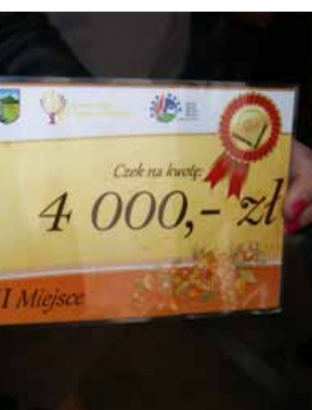
Sołectwo Strupina otrzymało nagrodę finansową w wysokości 4 tys. zł

Wieś pięknie bo ludzie się cieszą i kontynuują swoje działania na rzecz poprawy jej estetyki i wizerunku. Dbają o świetlicę wiejską, a także o swoje zagrody. Mieszkańcy poprzez liczne działania nawiązują między sobą bliższe więzi i są radośniejsi. Motywują władze gminne do inwestowania na ich terenie. Tym sposobem wyremontowano szkołę, wybudowano Orzełka – boisko wielofunkcyjne oraz