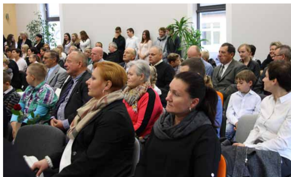
Na Sali Gminnej Biblioteki Publicznej „Multiteki” znaleźli się również rodzice, a także inne osoby, które miały swój udział w powstaniu i działaniu prusickiej szkoły przez ostatnie 10 lat