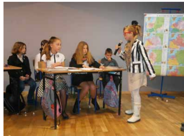
Część artystyczną przygotowali uczniowie klas IV i V wraz z wychowawczyniami