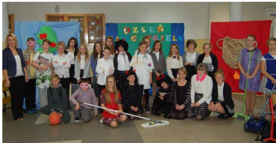
Wraz z uroczystościami 10-lecia ZS w Prusicach zbiegły się obchody Dnia Edukacji Narodowej, w związku, z którym uczniowie przygotowali wystąpienia artystyczne