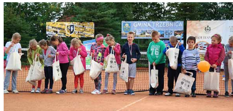
Gmina Prusice ma również swoich tenisowych Stypendystów wyłonionych w drodze Tenisowego Turnieju Gmin

Impreza miała na celu wyłonienie najzdolniejszych sportowców z klas 1–3 szkoły podstawowej z terenu trzech gmin: Prusice, Trzebnica i Oborniki