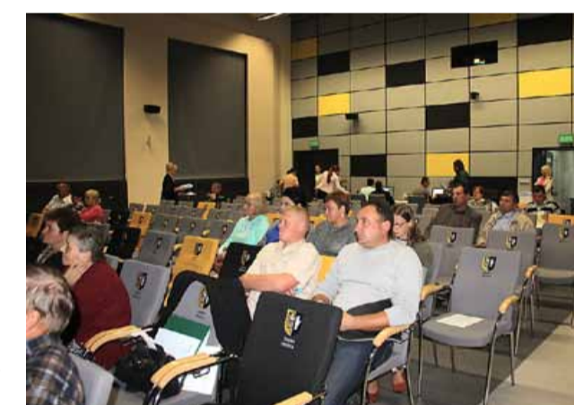
Podczas spotkania w Prusickim Obiektwie Multifunkcyjnym Sołtysy i Radni zostali poinformowani o zasadach funduszu sołectkiego na 2016 rok

Od 2010 roku sołectwa Gminy Prusice korzystają z funduszu sołectkiego, który ma służyć poprawie warunków życia