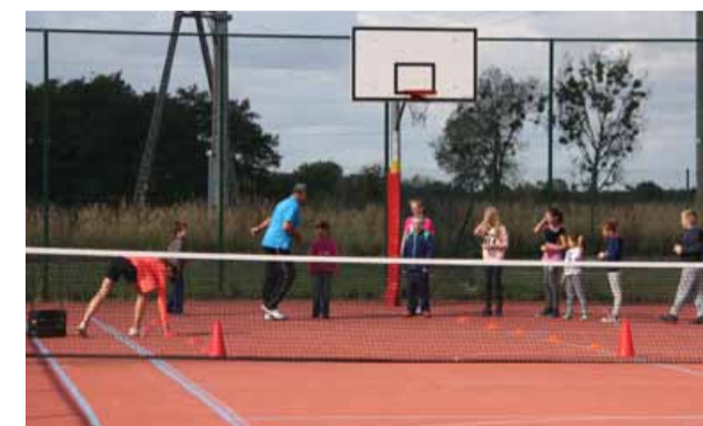
Doświadczeni adepci doskonalili swoją grę w tenisa

Jak się dowiedzieliśmy, do tej pory, zajęcia odbywały się w Skokowej, Obornikach Śląskich i Trzebnicy, na boiskach Orlik natomiast podczas zimy uczestnicy trenują na Sali spor-