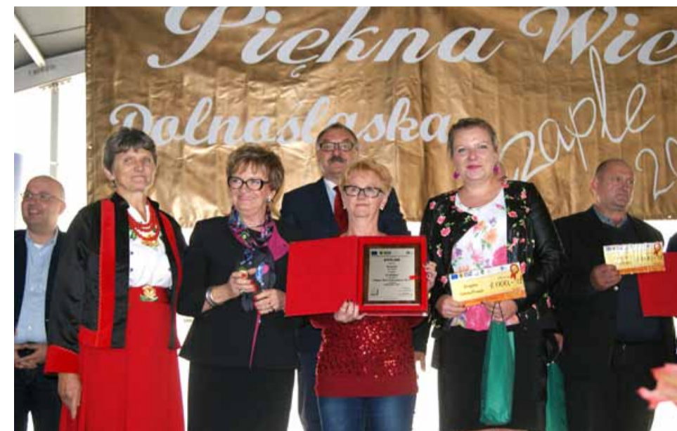
Sołectwo Strupina podczas finału w Czaplach odebrało nagrodę za II miejsce w kategorii Najpiękniejsza Wieś Dolnośląska w ramach konkursu Piękna Wieś Dolnośląska

społeczny, który inicjuje działania i je realizuje. Bardzo ważne, że mieszkańcy umieją działać razem z innymi podmiotami: Parafią, szkołą, gminą, powiatem, prywatnymi firmami oraz innymi sołectwami.