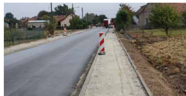
Budowa obustronnych chodników we wsi Kaszyce Wielkie

Gmina Prusice w porozumieniu z Powiatem Trzebnickim oraz w partnerstwie ze Stowarzyszeniem Gmin Turystycznych Wzgórz Trzebnickich i Doliny Baryczy z siedzibą w Żmigrodzie, realizuje w ramach „Narodowego Programu Przebudowy Dróg Lokalnych – Etap II Bezpieczeństwo – Dostępność – Rozwój”, zadanie pn. „Poprawienie parametrów technicz-