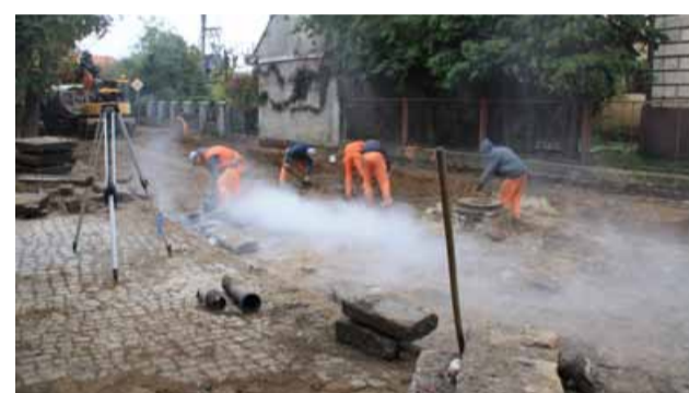
Wymiana nawierzchni i kanalizacji na ul. Kolejowej w Prusicach

stycji, w znacznym stopniu polepszy się dojazd do wsi Kaszyce Wielkie, a co za tym idzie zwiększy się jej atrakcyjność dla inwestorów, potencjalnych nowych mieszkańców szukających dogodnego miejsca do osiedlenia – podkreśla wódczyni gminy dodając: – Trasa ta jest również główną arterią komunikacyjną w samej miejscowości. Zmodernizowana droga podniesie standard życia mieszkańców sołectwa, uczyni wieś atrakcyjniejszą dla ludności. Poprawa oznakowania