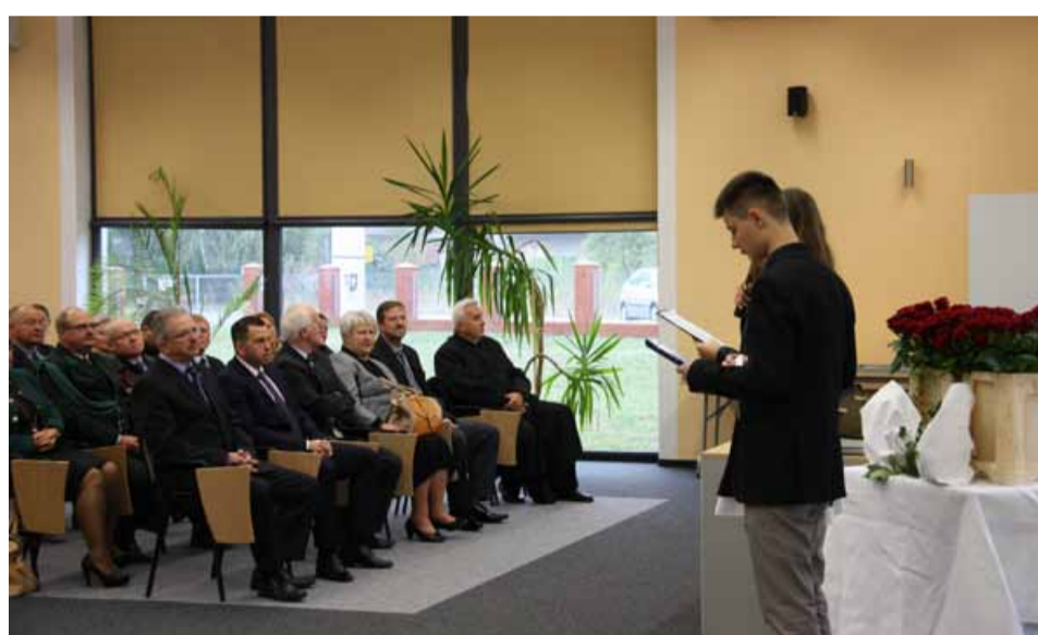
W uroczystych obchodach Jubileuszu wzięli udział zaproszeni goście