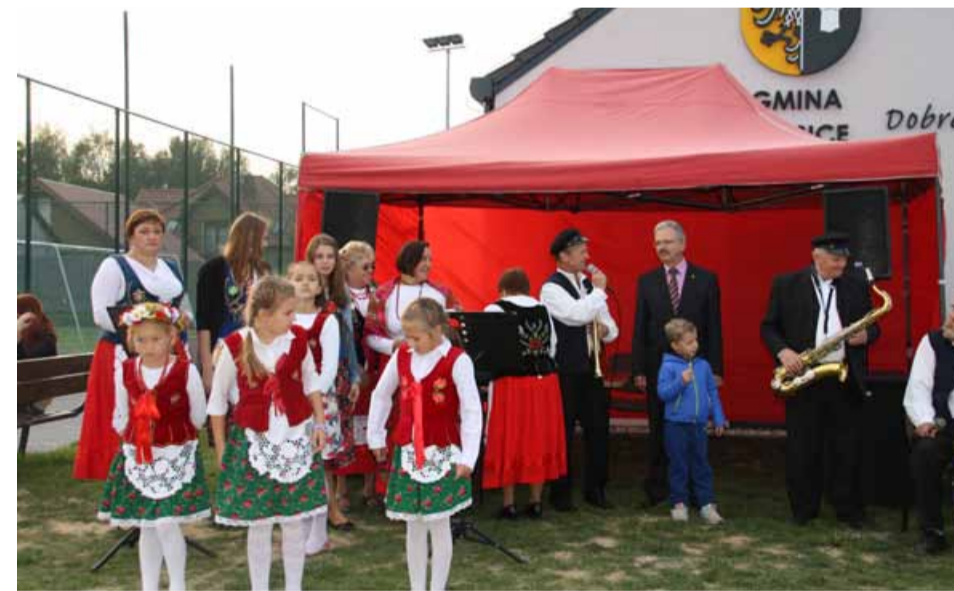
Tradycyjnie podczas Święta Jabłka i Szarlotki w Pawłowie Trzebnickim wystąpił Zespół Ludowy „Trzy Dęby” z Borówka

sportowych nie zabrakło emocji sportowych za sprawą meczu Żonaci kontra Kawalerowie. Tradycyjnie w ramach Biesiady Ludowa „Trzy Dęby” z Borówka oraz „Bzykowanie” z Brzykowa. Impreza została zorganizowana przez Stowarzyszenie Aktywni z Pawłowa Trzebnickiego przy wsparciu Gminy Prusice i Stowarzyszenia LGD Kraina Wzgórz Trzebnickich.