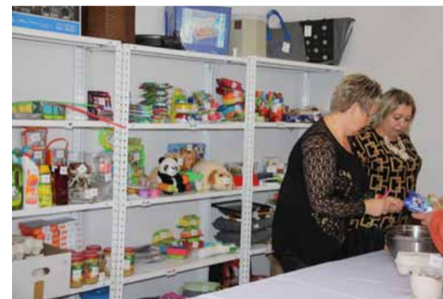
Dochód zebrany w ramach loterii fantowej został przeznaczony na potrzeby miejscowego kościoła

Jak co roku, aby spróbować najlepszego ciasta z jabłkami należało udać się w sobotę 26 września 2015 roku do Pawłowa Trzebnickiego, gdzie odbywało się Święto Jabłka i Szarlotki. Już po raz szósty mogliśmy podziwiać i posmakować najprzeróżniejszych wypieków z jabłkiem w roli głównej. Na kompleksie boisk