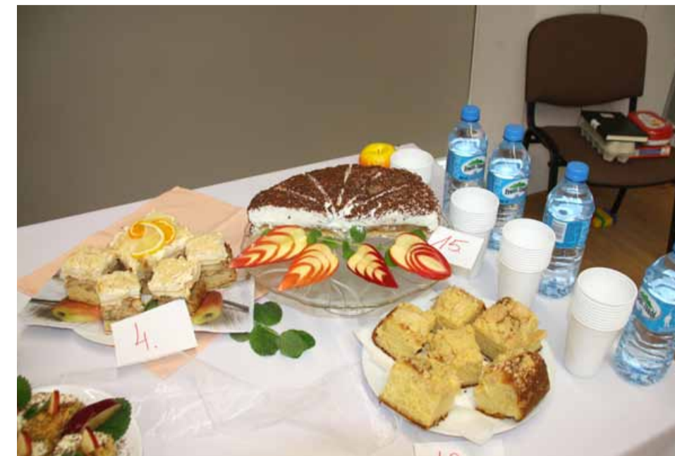
Do konkursu na najlepsze wypieki z jabłkami zgłosiło się 16 ciast