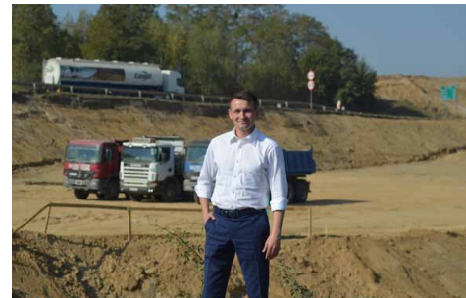
Postępy prac na budowie S5

wa na budowę drogi została już podpisana i z końcem 2017 roku mieszkańcy będą mogli z niej skorzystać. Będzie to droga ekspresowa z dwoma pasami ruchu w każdym kierunku oraz pasami awaryjnymi. Zgodnie z przepisami pojedziemy tam z prędkością 120 km na godzinę. Kolejnym krokiem, który musi zostać podjęty będzie powołanie Wrocławskiego Związku Metropolitalnego, w którego