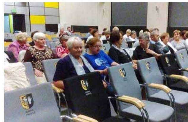
Studenci Uniwersytetu III Wieku podczas Inauguracji w Gminnym Ośrodku Kultury i Sportu w Prusicach

Wszystkim nauczycielom, wychowawcom i pracownikom serdecznie gratulujemy i życzymy dalszych sukcesów w pracy opiekuńczej, wychowawczej i dydaktycznej.