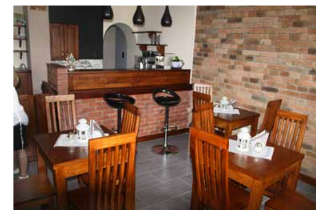
W Kawiarence Pod Trzema Wieżami nie tylko można napić się kawy, ale także uzyskać informacje dla NGO i dowiedzieć się o atrakcjach turystycznych

W kawiarence funkcjonuje także Centrum Wsparcia Organizacji Pozarządowych, gdzie to organizacje z terenu gminy mogą uzyskać informacje na tematy dotyczące ich działalności, pomoc w pozyskaniu funduszy zewnętrznych, a także w pisaniu