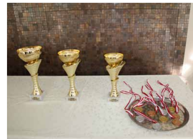
Dla najlepszych czekały medale i puchary

Impreza, oprócz wymiaru sportowego, miała charakter rodzinnego pikniku z wieloma atrakcjami. Uczestnicy mogli spróbować swoich sił na polu golfowym, strzelnicę golfową oraz w minigolfie.