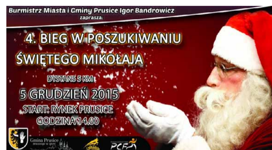
Regulamin i informacje o zapisach www.bieg.prusice.pl