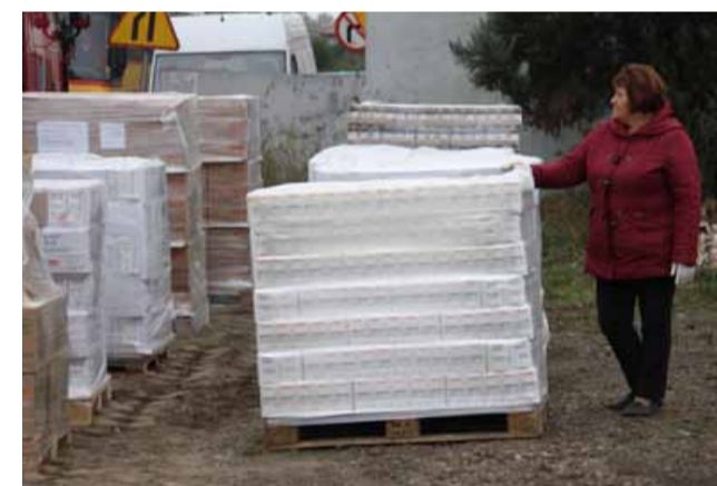
Stowarzyszenie Skokowiak odebrało kolejny transport żywności w ramach programu unijnego PEAD. Wolontariusze chętnie pomagają w rozdaniu żywności do Prusickiego Banku Żywności

Stowarzyszenie Skokowiak odebrało kolejny transport żywności i w dniach od 15 do 19 października 2015 roku rozdawało żywność dla potrzebujących Mieszkańców z terenu Gminy Prusice.