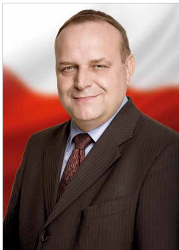
Jarostaw Duda Senator Rzeczypospolitej Polskiej

Wystartowałem w pierwszych wyborach do Sejmiku Województwa Dolnośląskiego w 1998 roku i od 2002 do 2004 roku pełniłem funkcję wiceprzewodniczącego Sejmiku oraz przewodniczącego Komisji Polityki Społecznej i Rodziny. W tym okresie pracowałem też jako Zastępca Prezesa Zarządu Państwowego Funduszu Rehabilitacji Osób Niepełnosprawnych w Warszawie (1999–2001) oraz