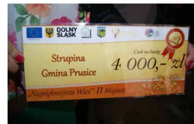
Sołectwo Strupina otrzymało nagrodę finansową w wysokości 4 tys. zł

Strupina – różana wieś licząca ok. 500 mieszkańców położona jest na Wzgórzach Strupinickich w Gminie Prusice. Jej otoczenie stanowią piękne krajobrazy lasów, łąk i pól uprawnych. Prawdziwym bogactwem sołectwa są jej mieszkańcy. To kapitał